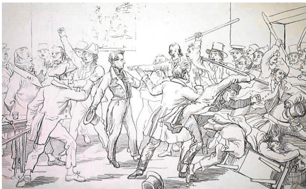
Abb. 3: Regierungsrat Waller wird in Muri verhaftet und ins Gefängnis gesteckt. Erschienen in: Schweizer Bilderkalender 1842.

würde ohne die Klöster in absehbarer Zeit zu einer liberalen Hochburg werden. Zeitlebens blieb er mit seiner liberal-radikalen Einstellung in seinem Bezirk in der Minderheit und war entsprechend auch Anfeindungen ausgesetzt. Nichtsdestotrotz schien er auch viele Anhänger und Bewunderer zu haben. Ohne Zweifel stellte sein Engagement rund um die Klosteraufhebung seine vorherigen und nachmaligen Tätigkeiten in seinem Bezirk in den Schatten, denn die meisten Quellen über ihn stammen aus der stürmischen Regenerationszeit. Seine späteren Engagements für das Allgemeinwohl sind daher kaum mehr greifbar oder müssten – sofern Quellen dazu vorhanden sind – erst aufgearbeitet werden. Dies führt letztlich zu einer verzerrenden Rezeption seines Lebenswerks, indem sein Kampf gegen die Klöster und Katholisch-Konservative der 1840er Jahre diese klar dominiert und anderes verdrängt. So gesehen polarisiert der einst umstrittene Josef Leonz Weibel in der historischen Aufarbeitung heute nicht mehr, da sein Anteil an den Ereignissen der 1840er Jahre weitgehend geklärt ist. Allerdings erschweren es die einseitige Quellenlage sowie das bisherige Forschungsinteresse, seiner Person gerecht zu werden.